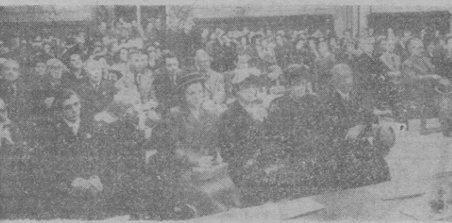
Barcelona. — Un momento de la solemne ceremonia de la inauguración de la Asamblea Nacional de Arquitectos de España en el Salón de Ciento del Ayuntamiento de Barcelona.