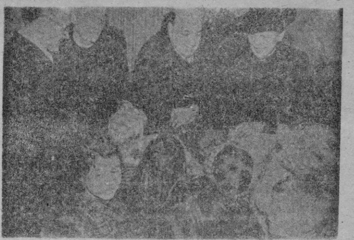
Frankfort.—El Cónsul General de España, señor García Comín, acompañado de su esposa y otras personalidades, reparte entre los niños de la ciudad el cargamento de naranjas enviado por España como obsequio. En la cara de los niños se refleja la alegría que les produjo recibir los deliciosos frutos de nuestra Patria.