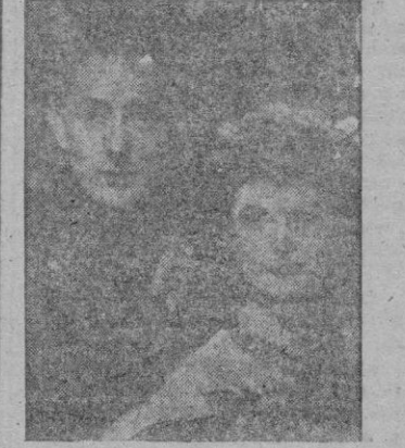
Anna Neagle y Michael Wilding, en una escena.

★ CINE ★ "La casa de los Courtneys" (Sala Astoria Protectora y Metropol)