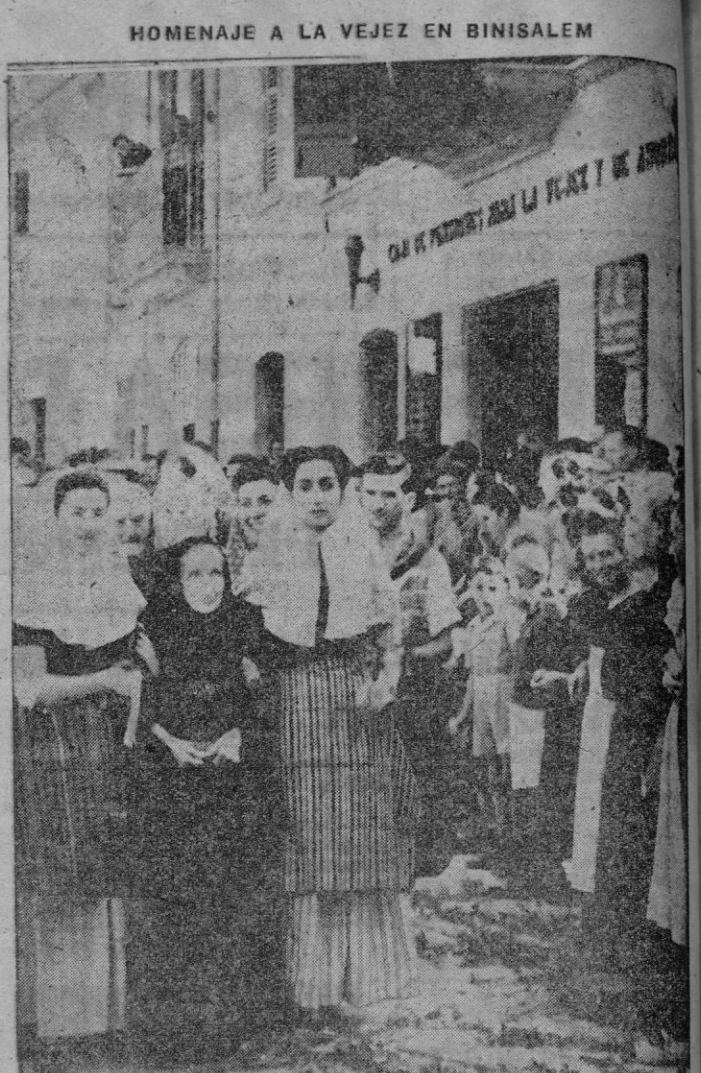
Un aspecto del Homenaje a la Vejez, celebrado en Binisalem, en motivo de la bendición del nuevo edificio de la «Caja de Pensiones para la Vejez y de Ahorros». — (Foto Juanet).