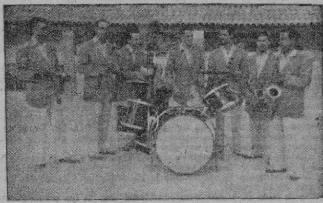
Entre las orquestas mallorquinas, que de un tiempo a esta parte van logrando envidiable situación entre los conjuntos españoles, está «Trocantes», veterana y novel a la vez, constituye una esplendorosa realidad de agrupación musical moderna.