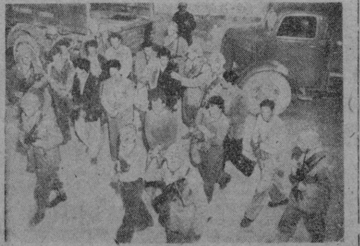
Roma.— Interesante fotografía que recoge a un grupo de comunistas italianos con grillas, conducidos por soldados del Ejército. Se habían echado al monte en la Abadía de San Salvador, después del atentado contra Togliatti.