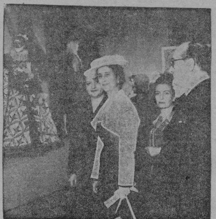
Madrid. — La esposa del Caudillo, doña Carmen Polo de Franco con el Ministro de Educación Nacional, visita la Exposición de Teatro, en la Biblioteca Nacional.