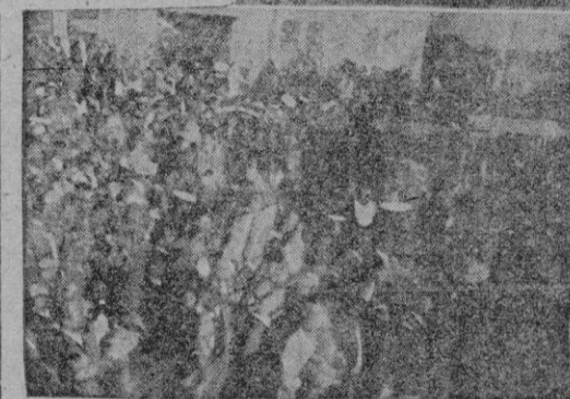
Ascenso automático a II División

Este era el aspecto que presentaba el muelle de Palma en aquella época esplendorosa de ascenso. Esta era la afición enardecida. ¿No se intentará devolverle lo perdido?