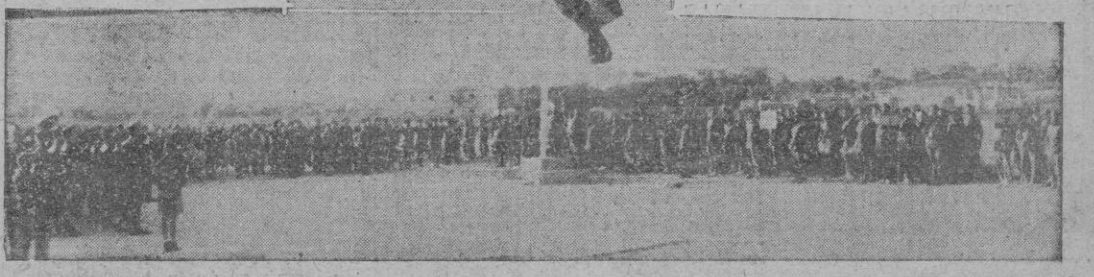
Momento solemne del acto de arriar la bandera, momento emocionante y que se ha repetido a diario, en el Campo de Deportes Militar, con motivo de la disputa de los Campeonatos de Baleares de Atletismo.