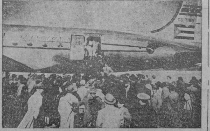
Aeropuerto de Barajas. — Un momento de la llegada a Barajas del avión «Estrella de Cuba», cuyos pasajeros —periodistas cubanos invitados para visitar nuestra Patria— fueron recibidos por representantes del Ministerio de Asuntos Exteriores, Cultura Hispánica y periodistas de Madrid.