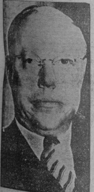
El senador Robert Taft, cuyo nombre junto al de Mr. Stassen, se cree con más posibilidades de ser elegido entre todos los candidatos a las elecciones presidenciales de Norteamérica.