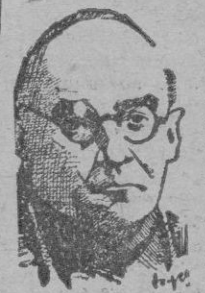
PLA Y DENIEL

A continuación el Dr. Pla y Deniel resumió el acto y exhortó a todos a propagar esta magnífica obra, que tan óptimos frutos ha dado. Seguidamente entregó varias becas de 1.000 pesetas a estudiantes. La primera de estas becas lleva su nombre. — (Cifra).