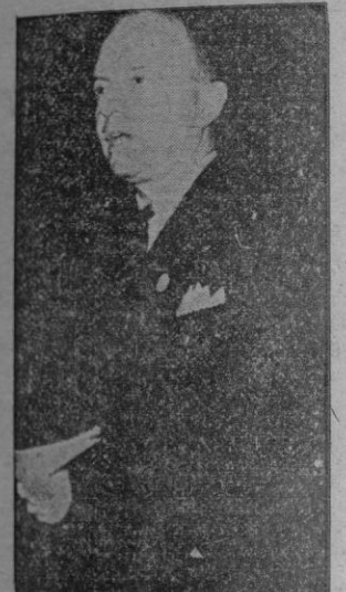
Mr. Harold Stassen, a quien con Mr. Taft, se cree con más posibilidades de ser elegido entre todos los candidatos a las elecciones presidenciales de los EE. UU.

Candidatos republicanos para las elecciones presidenciales de Norteamérica