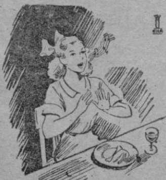
Bien canta Marta cuando está harta