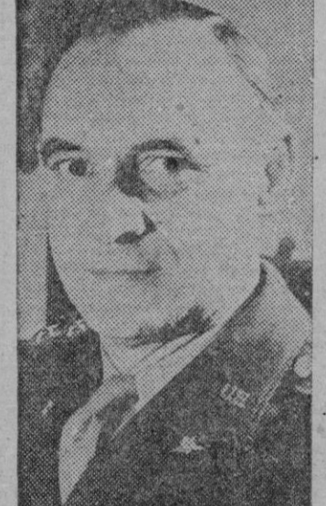
General LUCIUS CLAY

El acuerdo supone, en realidad, la creación artificial de un nuevo país —Bizona—, y, por consiguiente, la ruptura completa con los acuerdos de Potsdam y Yalta. Es este el último fracaso de las negociaciones entre los «cuatro grandes» respecto al destino de lo que fué «III Reich».