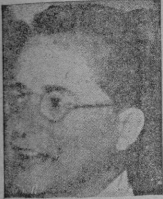
TOGLIATTI uno de los mejores agentes del comunismo internacional

No es ningún secreto esto de decir que Italia sigue con sus sueños coloniales en pie. Hace unos meses el entonces subsecretario para el África italiana — y no respondemos de la exactitud de la etiqueta que cubría el cargo — organizó una pequeña fiesta en honor de los ex combatientes indígenas. El «concrevole» Brusasca les habló cordialmente de toda la estupenda labor que su patria había desarrollado en las tierras coloniales, argumento de una fuerza y de una verdad evidentes. Ovidió decir — por un puro azar político — que la magnitud del trabajo colonial italiano lleva un claro e inequívoco apellido: fascista. Mussolini, Balbo y Amadeo de Aosta fueron los grandes propulsores de civilización en las provincias africanas, en las colonias y en el imperio. Sucedió que los ex combatientes indígenas — por eso de que no suelen seguir los acontecimientos al día — entendieron maravillosamente las palabras de Brusasca, y al final de su disertación lo alaron en hombros y lo pasearon por la gran sala del festejo al grito de «¡E viva il Duce!» La cosa dió que hablar, pero no pasó de ahí.