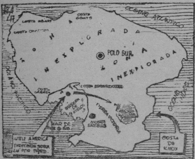
Mucho ruido en las rutas del gran Continente desconocido

Pero lo que da singular interés al asunto es una declaración evasiva formulada por el secretario de Estado norteamericano, y la inmediata réplica que ha tenido por parte de Chile y Argentina, a saber: