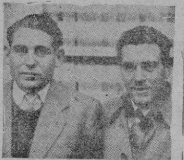
GUAL Y CAPO

rialmente para que la dureza de una temporada les fuera más llevadera. Luego como primera medida adoptamos la de enviarlos al Monasterio de Lluç para que allí se sometieran a una preparación concienzuda y al dar comienzo las carreras establecidas en el programa oficial se encontraran en la mejor forma.