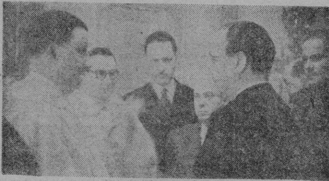
Madrid. — La Junta Nacional Ejecutiva pro Basilica Hispano-Americana en honor de Nuestra Señora de la Merced, que va a erigirse en Madrid entrega al Ministro de Justicia el nombramiento de Presidente de Honor de dicha Junta.