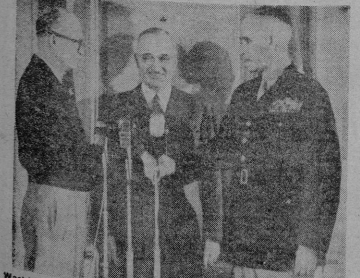
Washington. — Momento en que, en presencia del Presidente Truman, el general Eisenhower entrega la jefatura del Estado Mayor del Ejército norteamericano al general Omar Bradley.