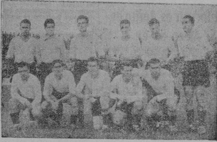
Los «encarnados» del Murcia, que en «Es Fortí» y con camiseta blanca, fueron vencidos (2-1) por el Mallorca.