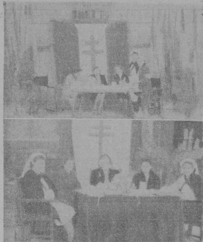
En los sitios más céntricos de la ciudad, fueron colocadas mesas para la recaudación de la Fiesta de la Flor, presidiéndolas juntamente con las ilustres damas esposas de nuestras primeras autoridades, enfermeras y señoritas postulantes.

Telaviv quedará hoy libre de tropas inglesas