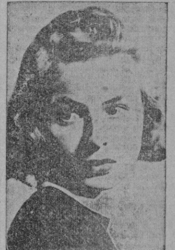
INGRID BERGMAN en «Noche de junio»

PRINCIPAL Ingrid Bergman, antes de Ingrid Bergman... Creemos que el dato, entre otros, pocos más, es lo más curioso de ese film suco, deslavazado y expresado con desigualdades notables, en muchos sentidos: Tanto en el puro relato argumental—oscuro y perdido a veces—, como en la técnica empleada.