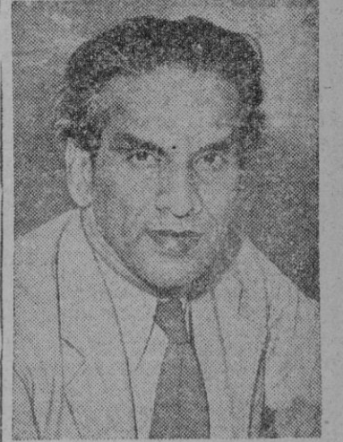
Mr. V. K. Krishna, nombrado recientemente Alto Comisario del Dominio de la India en el Reino Unido.