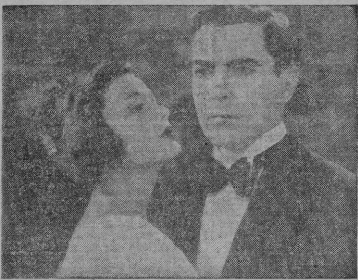
Tyrone Power y Gene Tierney en una escena de la magistral superproducción «El filo de la navaja», que será estrenada con toda solemnidad mañana jueves en Rialto-Moderno-Oriental

«A TRAVES DEL ESPEJO» Hoy en Astoria, Protectora y Metropol