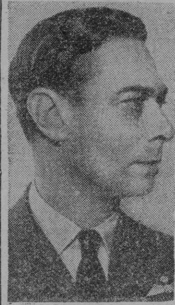
EL REY DE INGLATERRA

Londres. — (Servicio de exclusivas Pyresa. — International News Service). — Una pregunta en los labios de muchos extranjeros e ingleses es la de: «¿Cuál es la posición de Jorge VI en la actual crisis constitucional de la Gran Bretaña?» Hay todavía algunas otras interrogantes suplementarias que se presentan con frecuencia: «¿Está el rey obligado por la Constitución a leer un discurso del trono ante los miembros del Parlamento, de manera que no le agrade?» «¿Tiene poder para enmendarlo?» «¿Qué puede ocurrir si refusa leer el discurso?»