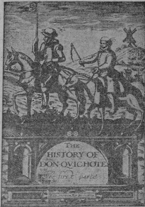
Edición inglesa, Londres, 1620