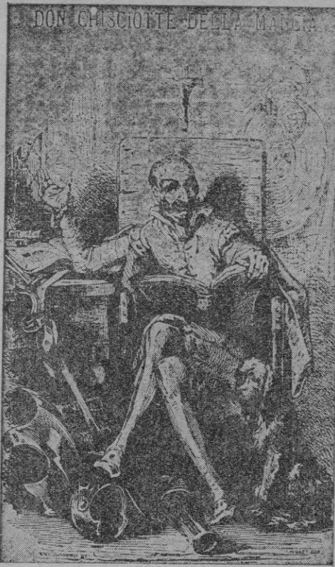
Edición Italiana, Milán, 1836

por AZORIN (De la Real Academia Española)