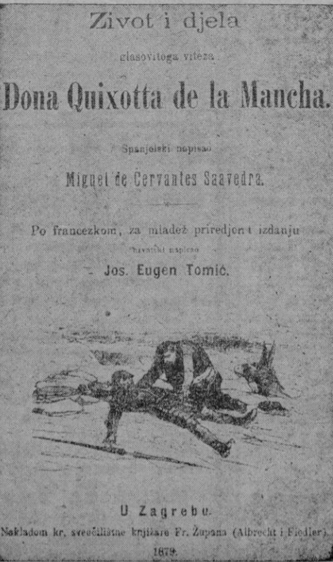
Una edición croata, en Agram, 1879

Si no tuviese mil méritos de que echar mano la genial obra cervantina, la multiplicación ingente de sus ediciones serían pregón permanente de sus méritos. Fuera de los Libros Sentos, no ha existido libro salido de la inteligencia humana que haya conseguido el incesante homenaje de traducciones y ediciones que hasta hoy ha logrado «El ingenioso hidalgo Don Quijote de la Mancha».