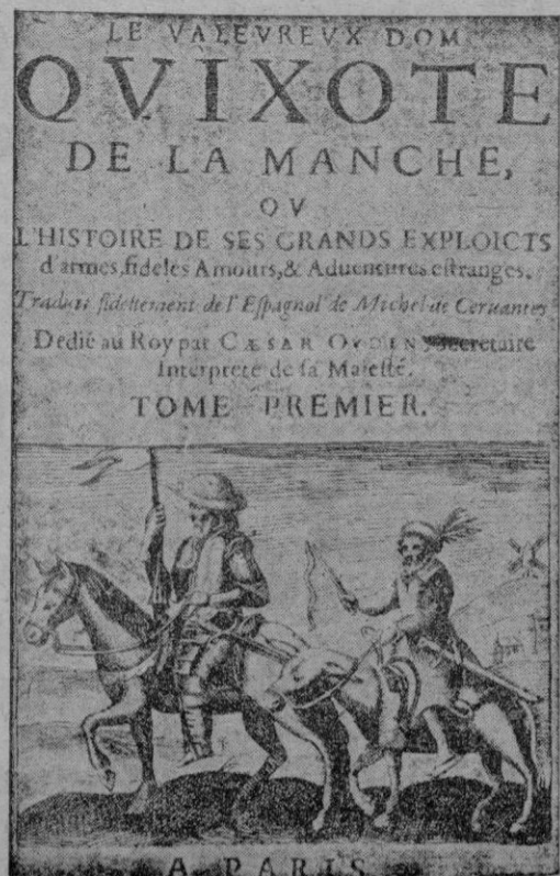
Edición francesa, en Paris, 1639