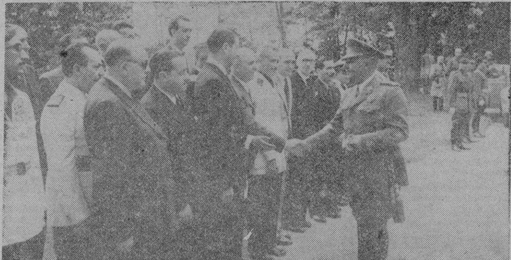
San Sebastián.—S. E. el Jefe del Estado, se despide de las autoridades de San Sebastián momentos antes de su salida de la ciudad..

No es ciertamente muy estimado (Continúa en tercera pág.)