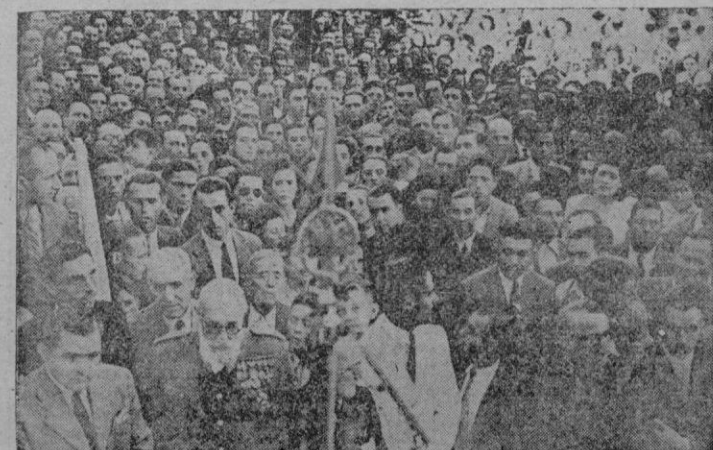
Jaen.—Una gran muchedumbre acudió al acto de dar el nombre del Presidente Peron a una de las principales Plazas de Arjona (Jaen), que dió vivas a Franco, a Peron, a la Argentina y a España. En primer término a la izquierda el Cónsul de la Argentina en Granada que asistió al acto.