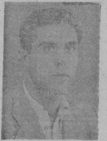
PERICÁS el que fué famoso portero del Atlético y del Constancia