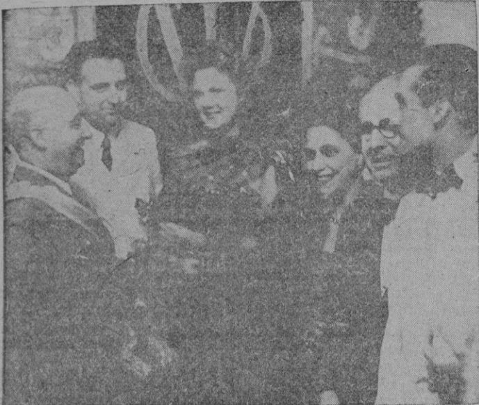
San Sebastián. — El Jefe del Estado, Generalísimo Franco, acompañado de su esposa, conversa, durante uno de los descansos con las artistas que intervinieron en la función de gala celebrada en su honor en el Teatro Victoria Eugenia.