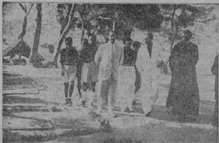
Una foto de la visita girada por el Excmo. Sr. Gobernador Civil y Jefe Provincial, al Campamento del Frente de Juventudes en Santa Ponsa

EL GOBERNADOR CIVIL EN EL CAMPAMENTO DE SANTA PONS