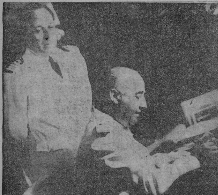
San Sebastián. — Dos momentos de la visita que S. E. el Jefe del Estado realizó al crucero «Argentina» anclado en el puerto de esta ciudad.