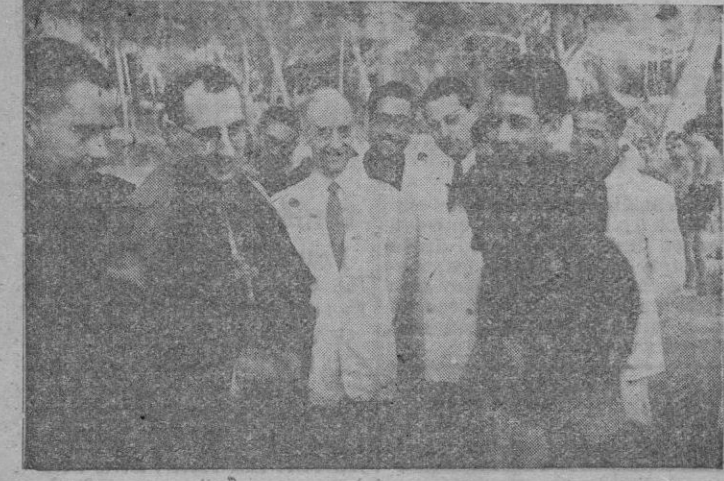
El Obispo Coadjutor, con el Alcalde de Palma, en un momento de su visita al Campamento del F. de J.

tenido conmigo y estad seguros que os tendré presentes en mis oraciones. Los aprendices acompañaron a S. E. cantando con vigor el «Cristus Vincit» a la Capilla, cuidadosamente instalada en una tienda, magníficamente adornada. Seguidamente el Sr. Obispo entonó la Salve, cantada con gran fervor por los acampados quienes después de desfilar y besar el pastoral anillo de S. E., le despidieron acompañándole largo trecho con gran entusiasmo, vítores y aplausos.