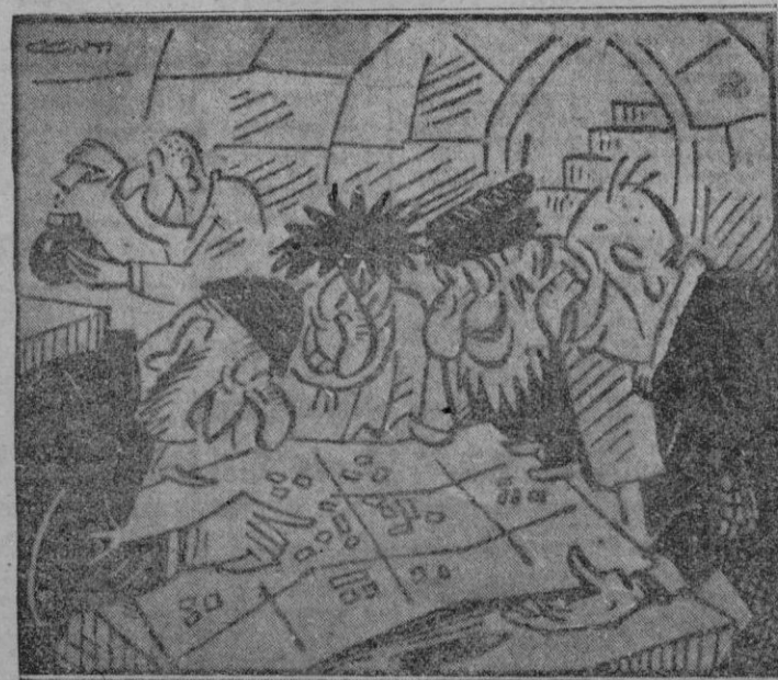
—Mañana destruiremos estos bloques de casas, esta línea férrea y volaremos ese puente. ¡Todo sea por Palestina!