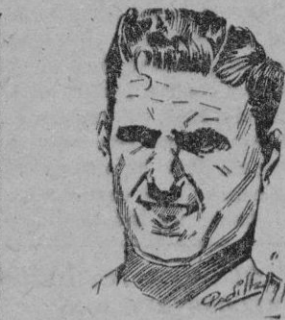
KUCHARSKI la máxima figura del baloncesto español

—No sólo lo tenemos pensado, sino que está ya ejecutando en su primera parte. Durante la temporada que acaba de terminar, y en la que, como sabes, se disputaron además de los campeonatos regionales y de España, el Primer Torneo de Liga en sus dos Divisiones y el Torneo Ibérico, la Federación, sin que los jugadores pudieran percatarse y, por lo