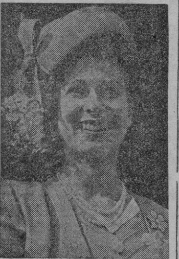
Un reciente retrato de Su Alteza Real la Princesa Isabel de Windsor, Heredera del trono Británico.