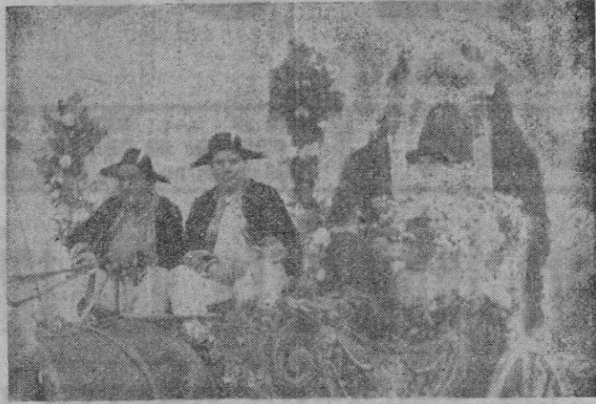
Un detalle del Carro Triunfal

El domingo, a las diez y media, luciendo la iglesia, lo mismo que el día anterior, su magnífica iluminación y sus mejores adornos se celebró la Misa Mayor solemnemente oficiando el M. Rdo. P. Antonio Bauzá, Provincial de los Franciscanos.