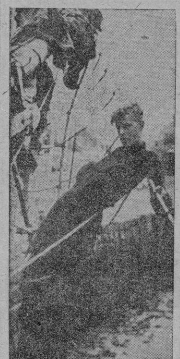
Felipe Mountbatten, Príncipe Consorte de Inglaterra, en una curiosa instantánea de cuando era cadete de la Marina Británica.

La nueva tradición fué seguida también en el casamiento del úl-