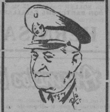
General Dutra, Presidente del Brasil

La Conferencia de Río de Janeiro tendrá, además, inusitada