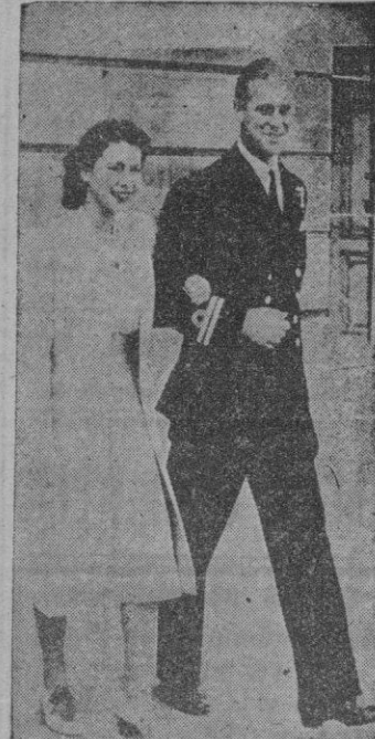
La Princesa Isabel y el Príncipe Felipe de Grecia, fotografiados por primera vez juntos después del anuncio oficial de su enlace matrimonial.

LONDRES. (Servicio especial de crónicas «EFE-United Press»). Prohibida la reproducción. — Con su compromiso matrimonial, el teniente Felipe de Mountbatten ha ganado a la princesa Isabel, pero ha perdido uno de los más preciosos derechos del hombre: el derecho a tener una vida privada. Así se comenta el anuncio oficial de la próxima boda de Isabel y