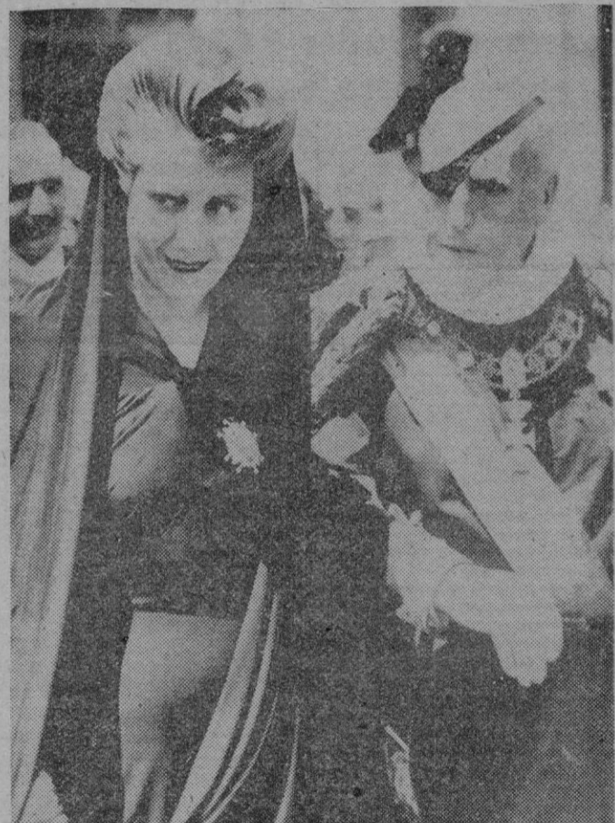
ROMA.—La ilustre dama argentina acompañada del Príncipe Chigi, er, el momento de entrar en la Basílica de San Pedro, después de ser recibida en audiencia especial por S.S. el Papa.—(Foto Cifra).

DONA MARIA EVA DUARTE DE PERON VISITA SU SANTIDAD EL PAPA