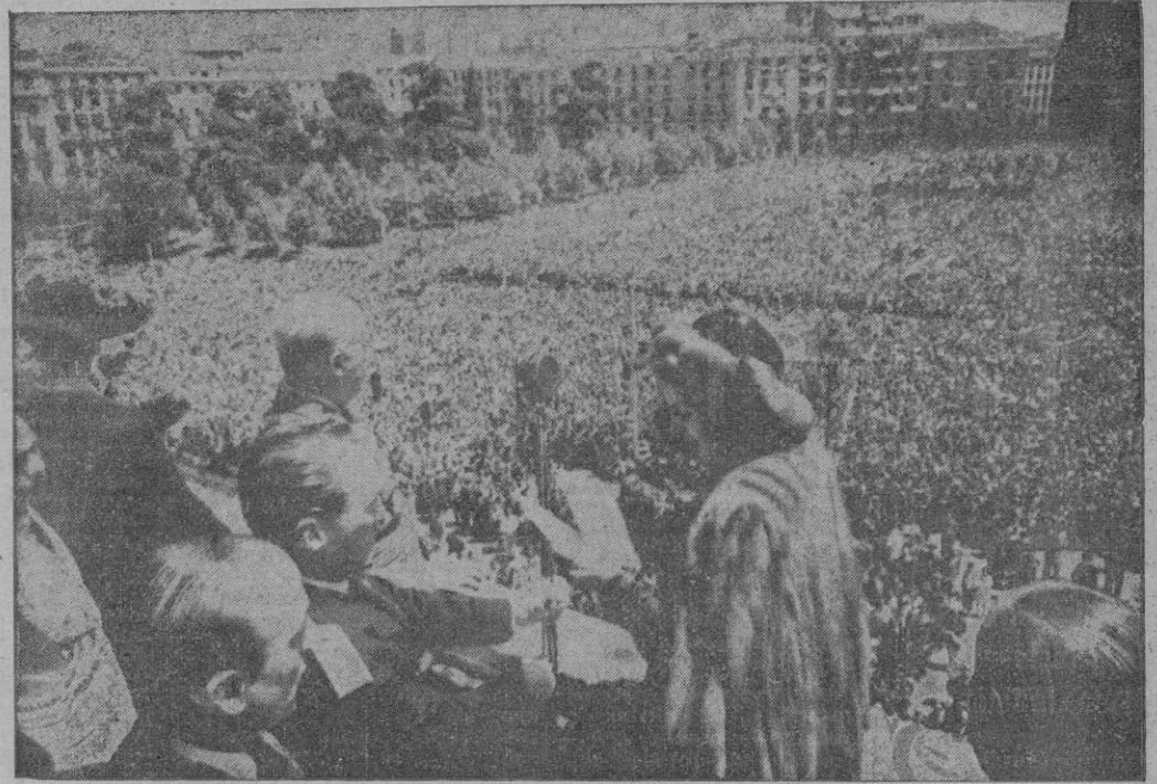
La esposa del Presidente argentino, doña María Eva Duarte de Perón, con S. E. el Jefe del Estado, en el balcón del Palacio de Oriente, desde el cual recibió la clamorosa y entusiasta adhesión del pueblo de Madrid.