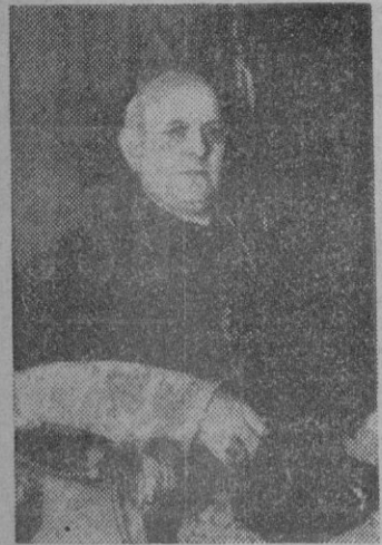
Su Eminencia el Cardenal Santiago Luis Copello, Arzobispo de Buenos Aires, a quien el Gobierno español ha concedido la Gran Cruz de Isabel la Católica.