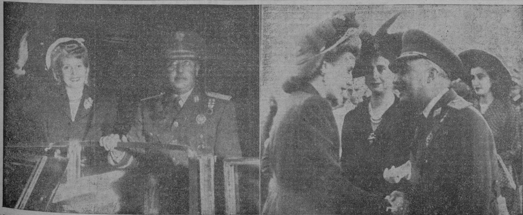
LA LLEGADA A MADRID DE DOÑA EVA DUARTE DE PERÓN.—S. E. el Jefe del Estado da la bienvenida a la esposa del Presidente Perón a su llegada al aeródromo de Barajas. En la foto de la izquierda doña María Eva Duarte, acompañada por el Caudillo, saluda a la población madrileña que aclamó a la ilustre viajera con entusiasmo inenarrable