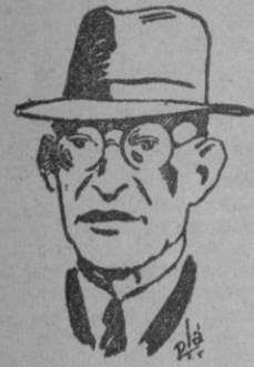
DE GASPERI probable sustituto de sí mismo

Una clamorosa salva de aplausos acogió las últimas palabras del Caudillo.