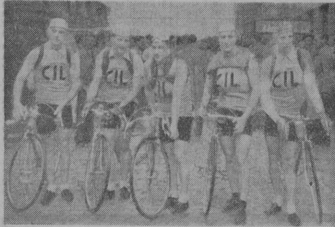
El equipo belga que participa en la Vuelta a España, cuyos elementos mejores intervendrán en la IX Vuelta Ciclista a Mallorca

Empezamos a recibir las contestaciones de las alcaldías de los pueblos del recorrido de la IX Vuelta Ciclista a Mallorca. El primero en contestar fué el de Lluch Mayor, siguiéndole Artá y hoy de, hemos de consignar las de Selva que nos concede 100 pesetas para una prima para el primero que pase por dicha localidad y otra prima de 50 pesetas al que llegue en primer lugar a Caimari. También el Ayuntamiento de Alcudia ha respondido a nuestro llamamiento enviándonos 50 pesetas para los gastos de organización. A todos ellos damos nuestras más expresivas gracias.