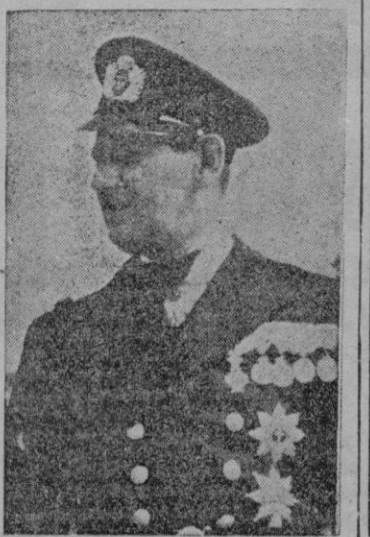
Text 29. — El príncipe Federico de Dinamarca que ha sido nombrado por su padre el Rey Cristián Regente del país, ante la gravedad de su estado. (Foto Cifra).

El avión prestará servicio en la línea del Atlántico septentrional. — Efe.