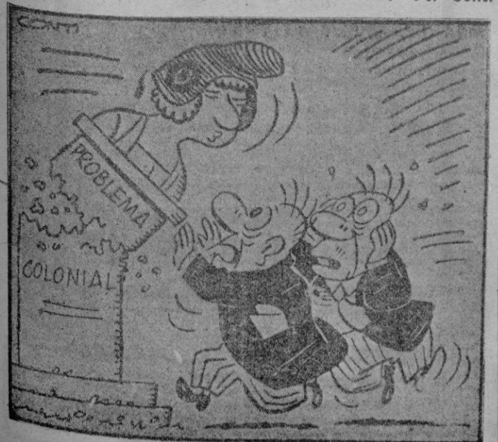
—Ya me lo esperaba, otra falla en los materiales de construcción.