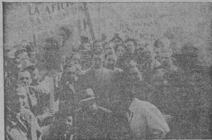
De regreso de América, ha llegado al aeropuerto de Barajas, el famoso diestro español Manuel Rodríguez «Manolote», siendo recibido entusiastamente por amigos y aficionados.