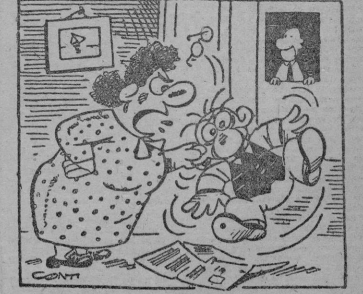
—Estabas diciéndole al vecino que el asunto entre Asunción y Concepción está mal; ¡Explicame quienes son esas señoras!