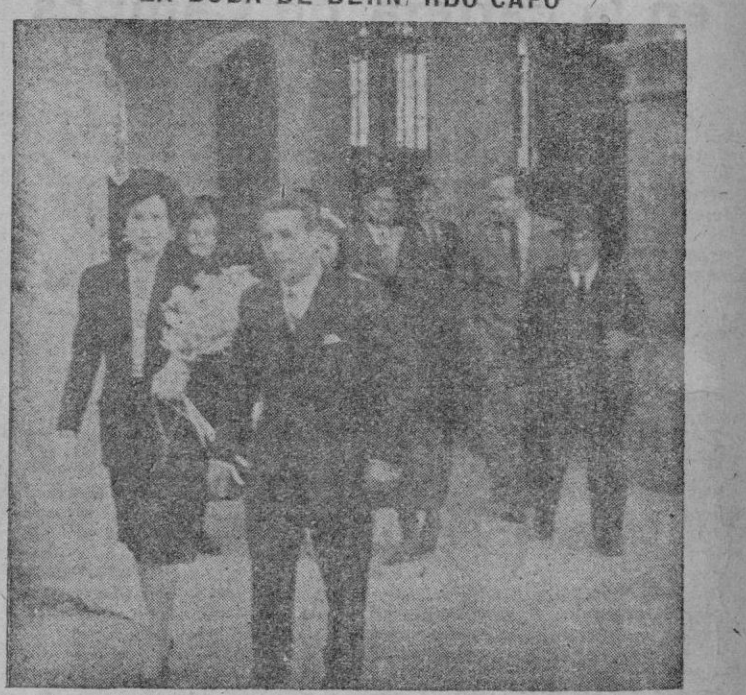
El famoso ciclista mallorquín, sale con su esposa de la iglesia del Monasterio de Lluch