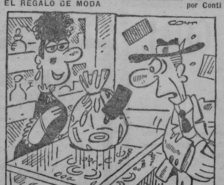
—«Esta pulsera tan sencilla, cien pesetas? Es muy cara. —Tenga en cuenta que el papel celofán que lleva el obsequio ya cuesta noventa pesetas.