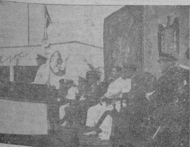
Momento de pronunciar su discurso de clausura el Excmo. Sr. Ministro de Industria y Comercio