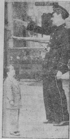
«Manolete» hace como si le preguntara a nuestro amigo el guardia por una calle.

—Yo conozco al otro «Manolete», y puedo asegurarle que es franca-