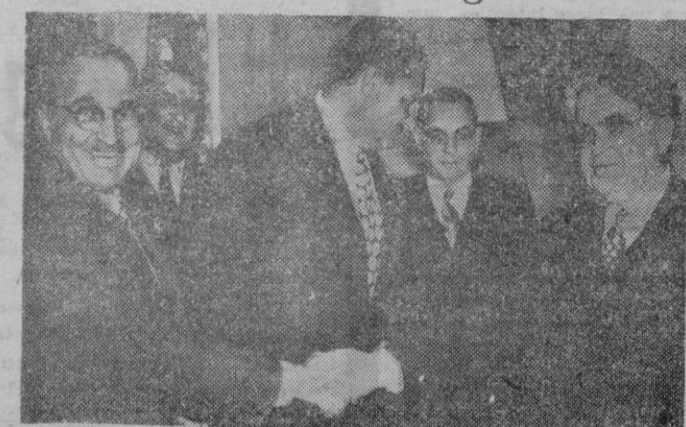
El Presidente Truman y el Presidente del Sindicato de Mineros, John L. Lewis, se dan la mano después de firmar el contrato que ponía fin a la huelga de los mineros