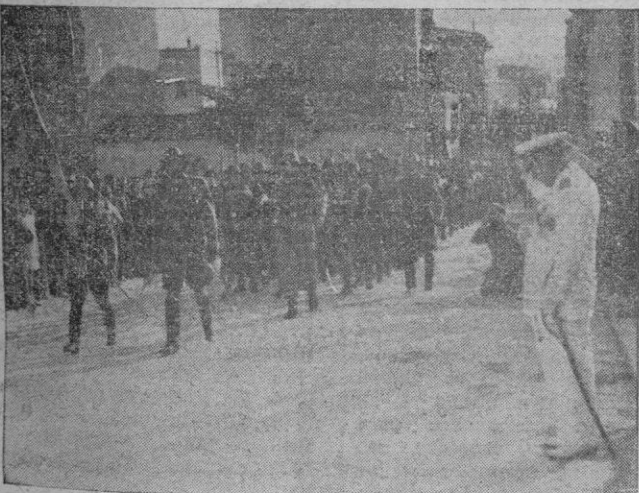
La Compañía del Regimiento de Infantería que rindió honores a S. E. desfila después de ser revista