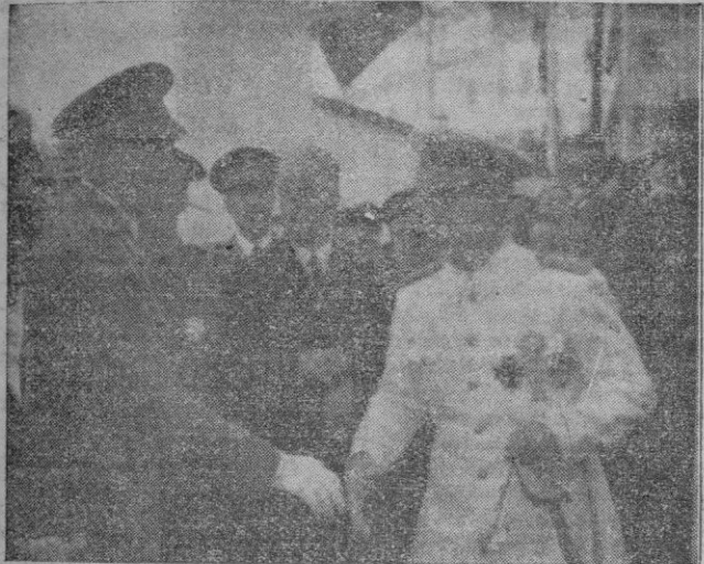
El Excmo. Sr. Ministro de Industria y Comercio señor Suanes, llegó a la Exposición, siendo recibido por nuestras primeras autoridades