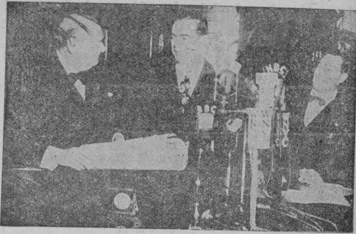
El Alcalde de Nueva York, O'Dwyer entrega a Mr. Churchill el diploma y la medalla de oro de la ciudad.