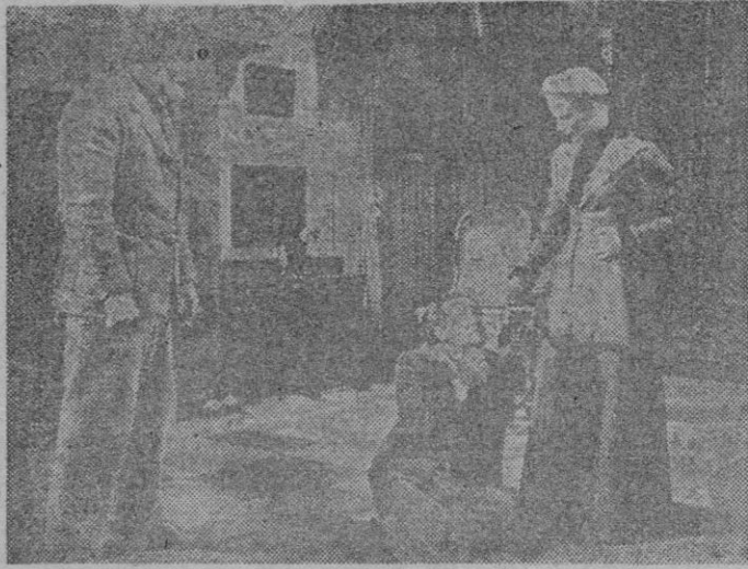
Un momento de la alucinante superproducción «Soberbia», que tras una larga permanencia en las carteleras de Barcelona, se está proyectando en Madrid en quinta semana a llenos diarios y que próximamente se estrenará en Palma con carácter de grandioso acontecimiento cinematográfico.

bitsch y que siendo ello así no ceja de advertirse la impronta de sus «toques» originalísimos en muchos pasajes de la película. El reparto de la misma se ajusta a estos nombres de garantía: Tallulah Bankhead, Charles Coburn, Anne Baxter, William Eythe y Vincent Price. La etiqueta de la cinta corresponde a 20th Century-Fox.