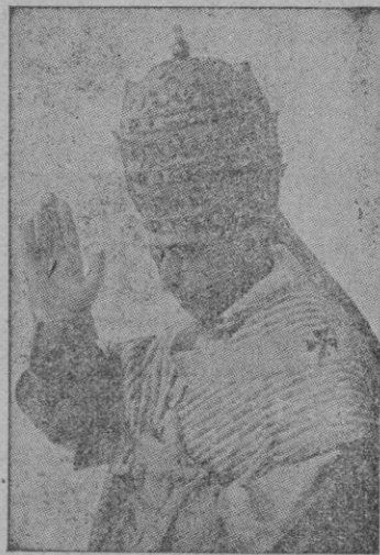
S. S. Pío XII

Por su cargo de Camarlengo de la Iglesia que se le había conferido en 1935 le tocó preparar, a la muerte de Pío XI, el Cónclave por el que fué él precisamente elegido sucesor el mismo día que cumplía 63 años de edad. Diez días después, el 12 de marzo, era coronado solemnemente.