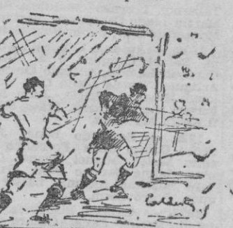
El mejor jugador de los 22 fué el portero del Córdoba.