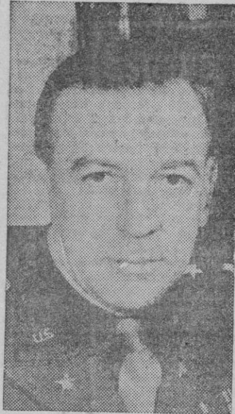
El Teniente General Sutherland, Jefe del Estado Mayor del General Mac Arthur y que tomó parte muy activa en las conferencias de rendición y ocupación del Japón

El Jefe del E. M. de Mac Arthur Se afirma en Washington