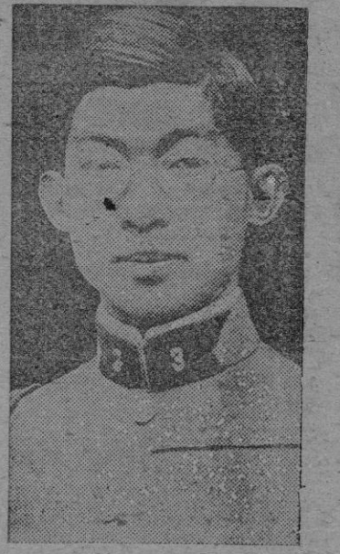
El Príncipe Chichibu, hermano del Emperador japonés Hiro-Hito y cuyo nombre suena como posible sucesor