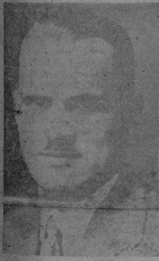
Arthur Compton, físico americano que ha intervenido en los trabajos para el descubrimiento de la bomba atómica, en Norteamérica.