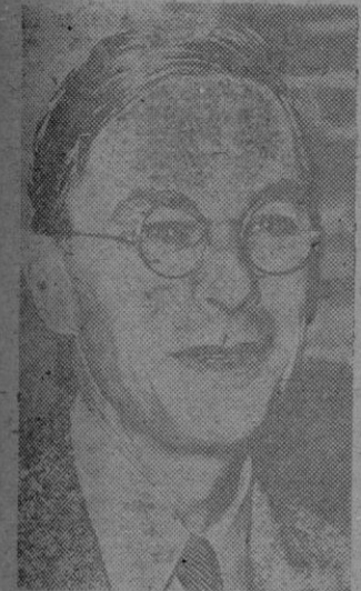
El presidente de la Universidad de Harvard, James B. Conant, uno de los investigadores que mas han trabajado para el descubrimiento de la bomba atómica.