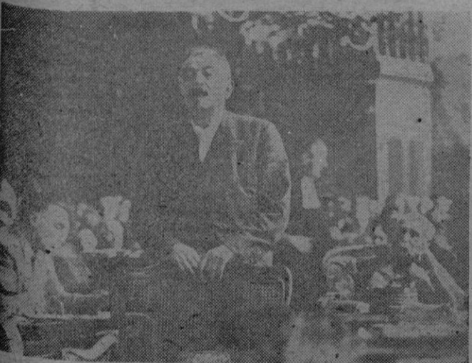
Laval durante su declaración. A la derecha, el Mariscal Petain escucha atento.