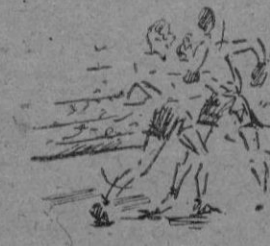
Valens-Fella que también resblieron su combate en tablas

que está viviendo una época un tanto agitada de renovación de valores.