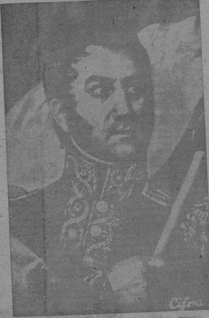
El General don José de San Martín.