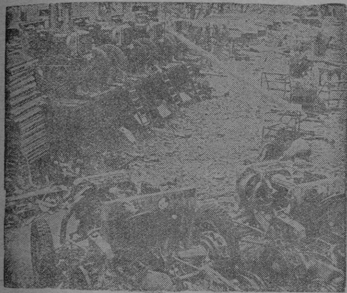
En esta fábrica destruida e inutilizada totalmente se producían vehículos sensorugas para las divisiones blindadas alemanas. Una vista de como quedó después de un bombardeo aliado.

Como quedó una fábrica alemana por los efectos devastadores del último ataque aéreo norteamericano