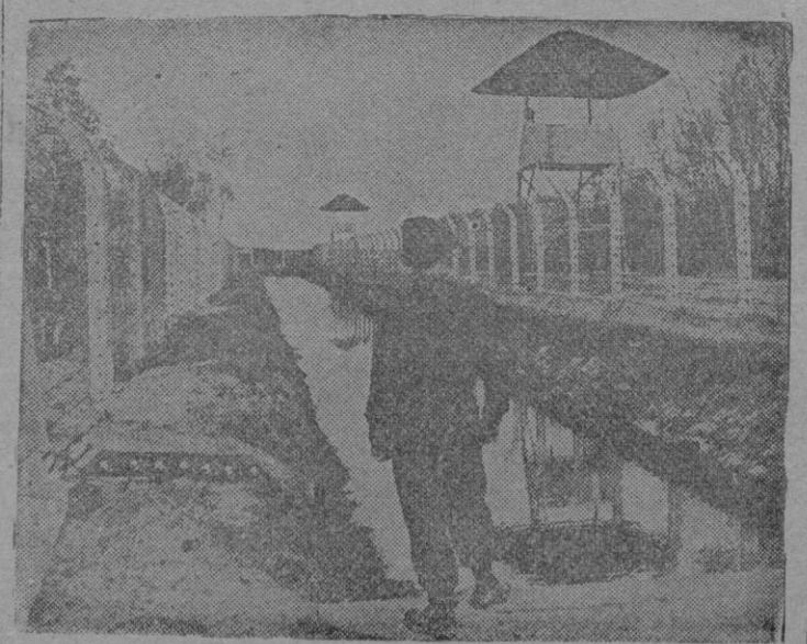
Un centinela añado frente al foso construido entre las filas de alambradas electrificadas, levantadas en un campo de concentración para ejecutar a los prisioneros condenados a muerte

Londres. — El Secretario de Estado para la India, Mayor Amery, ha declarado en un discurso pronunciado en Oxford, acerca de los problemas europeos, que es inadmisibile que Europa, madre de la cultura pueda quedar devastada y presa de la anarquía y del odio e incapaz de una acción común en la paz o en la guerra.