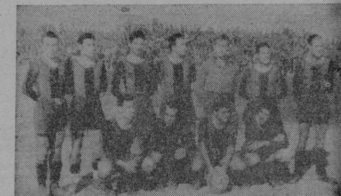
El último equipo del Levante que nos visitó, con motivo de la final de III División, y al que nuestro Mallorca, venció solo por 1-0

Un magno encuentro matinal se nos ofrece el próximo domingo en el campo de Son Canals, y es el cual los entusiastas muchachos del Atlético Baleares, se cuidarán de dar la debida réplica al cuadro de figuras que piensa desplazar el Levante para este encuen-