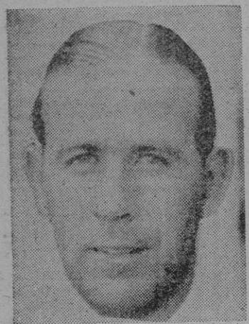
Primo, que probablemente reaparecerá el domingo frente al Betis.

con el fin de sacar el máximo rendimiento en su choque con el Real Betis Balompié de Sevilla