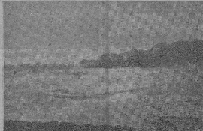
Playa de Cala Guya.

Exclusivamente para señoritas CLASES SELECTAS COMERCIO, CULTURA GENERAL, IDIOMAS, TAQUIGRAFIA Y CLASES PARTICULARES. CENTRO ESTUDIOS ESPECIALES SAN JAIME, 36, PRAL.