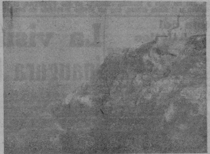
La torre del faro.

Por el lado opuesto al caserío, la campiña ostenta orgullosa todas las pompas de su lozanía, y