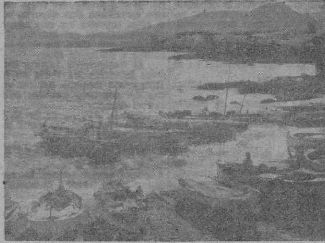
El caserío de Cala Ratjada.

Y en estos lugares donde lucían solitarias las plateadas fajas de las arenas y los peñales de las rocas, fué levantado el caserío de Cala Ratjada, que tan pronto se apiña como se desgrana por entre la arboleda formada por copudos pinos y frondosos higuerales.