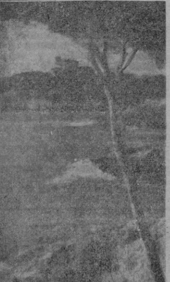
En el fondo el Palacio de don Juan March.

Allá, a lo lejos, en la somnolencia idílica del valle, se oye so-