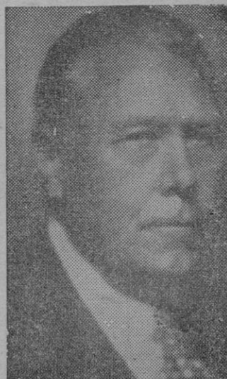
He aquí a Myron C. Taylor, conocido estadista norteamericano que actualmente representa al Presidente de los EE. UU. Franklin D. Roosevelt, en misión particular, ante Su Santidad el Papa