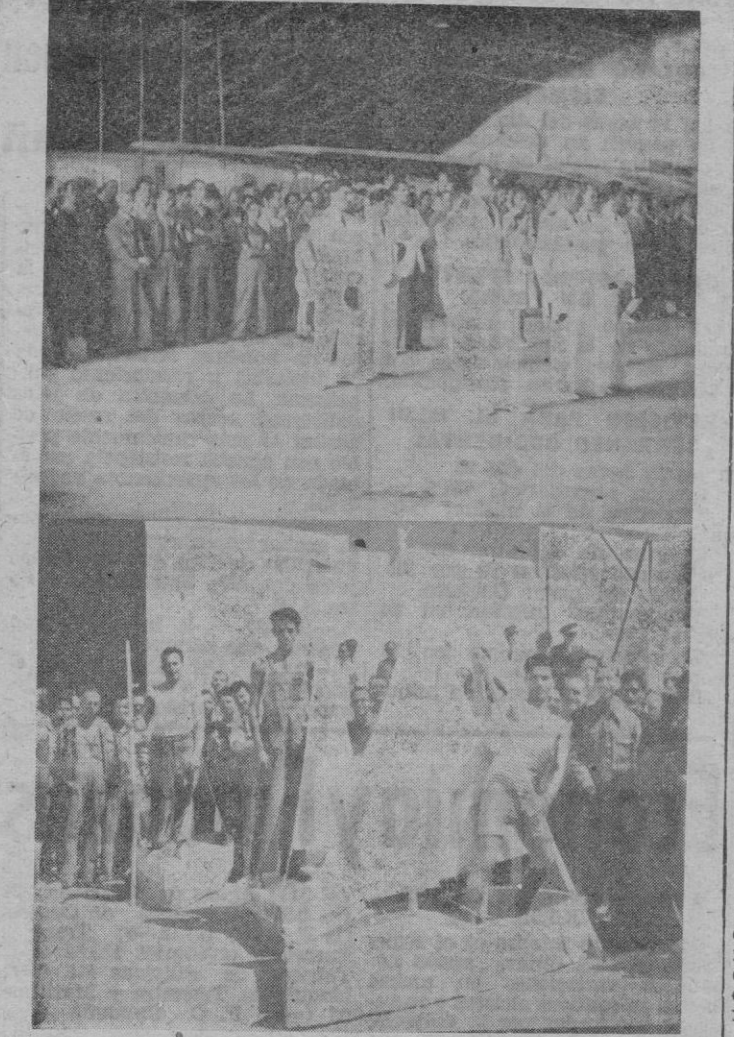
Un momento de la misa celebrada en los Talleres de Son Bonet, con motivo de los festejos conmemorativos del 18 de Julio. Los «balandros terrestres», momentos antes de tomar la salida en la carrera celebrada, y en la cual resultó vencedor el que figura en primer puesto.

La inscripción puede ya hacerse en el Ayuntamiento de Inca, o momentos antes de empezar la carrera en el campo d'Es Cos, lugar de salida de los corredores.