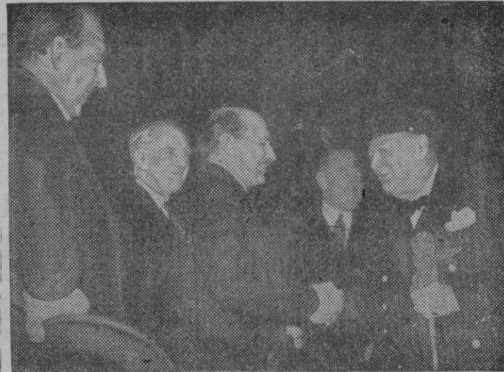
He aquí una foto del Primer Ministro británico al salir de Londres para inspeccionar la cabeza de puente del norte de Francia. En primer término, despidiéndose del «Premier», están los Ministros Attlee, Anderson y Lord Woolton