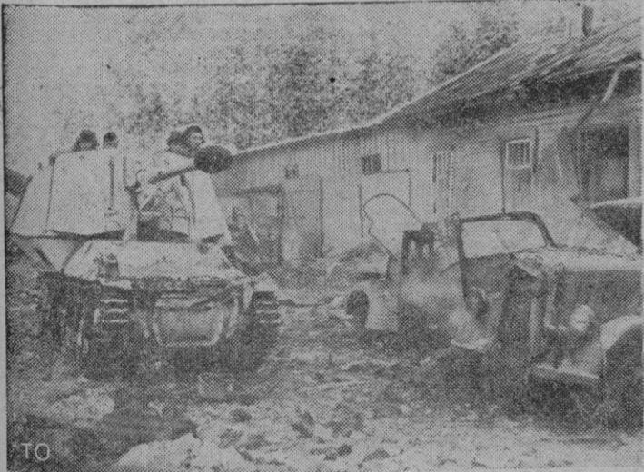
En una pequeña aldea de la península francesa de Cotentin se han librado duras escaramuzas. Esta instantánea nos muestra el movimiento en que un carro blindado alemán avanza por una de sus calles