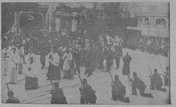
EN PALMA. — La Custodia al paso por la Plaza de Cort (Información el página 3.ª)

Londres. — Su Santidad el Papa ha recibido en el Vaticano al General Mark Clark, Comandante del V Ejército en audiencia privada, según comunica por radio el corresponsal norteamericano. — (Efe).