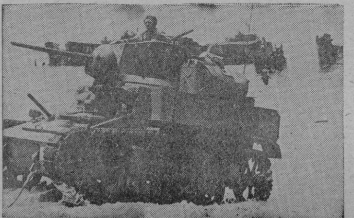
En la segunda foto vemos a carros norteamericanos en sus últimas maniobras pre-invasión