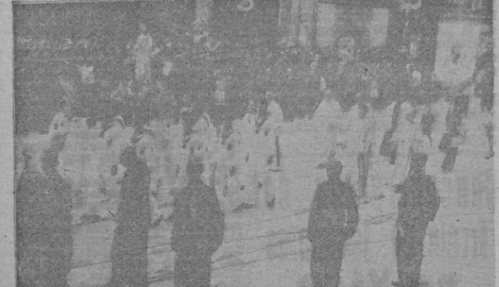
Los Flechas Navales llevando en andas a Ntra. Sra. de la Merced

Advertimos a los crucigramistas que no se tienen en cuenta las soluciones que no vergan con el correspondiente recorte del periódico.