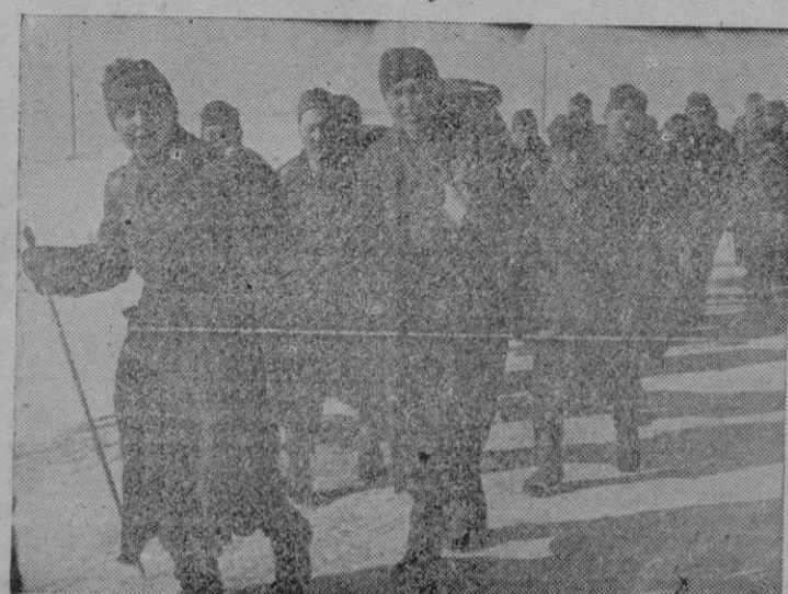
Un grupo de voluntarios del Turquestán que luchan al lado de las tropas alemanas dirigiéndose hacia el frente en el sector rumano