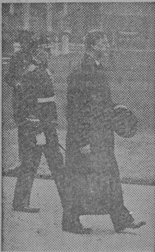
El Presidente del Estado Libre de Irlanda, que acaba de triunfar en las nuevas elecciones irlandesas, dirigiéndose al Palacio del Gobierno