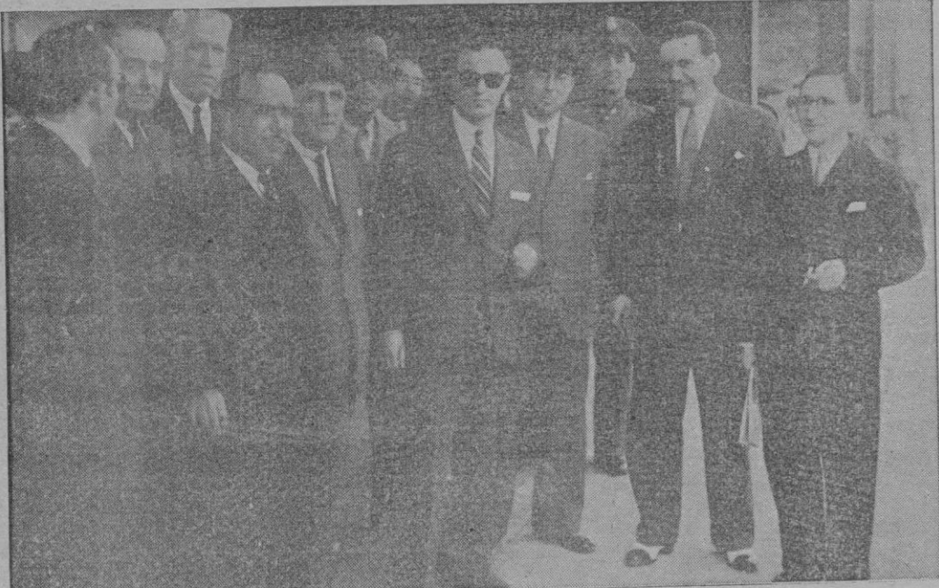
El Excmo. Sr. Gobernador Civil y Jefe Provincial a su llegada, con las autoridades y jerarquías que acudieron a recibirle

Mejoras obtenidas en los servicios de abastecimientos.—Halagüeñas esperanzas