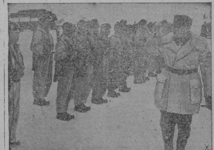
Después de seis días de una marcha, estos soldados finlandeses llegan al lugar en que han de relevar a camaradas alemanes. El Jefe de su unidad les pasa revista a su llegada.