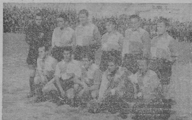
Equipo del C. D. Sabadell, que fué vencido por el Mallorca por 1-0.