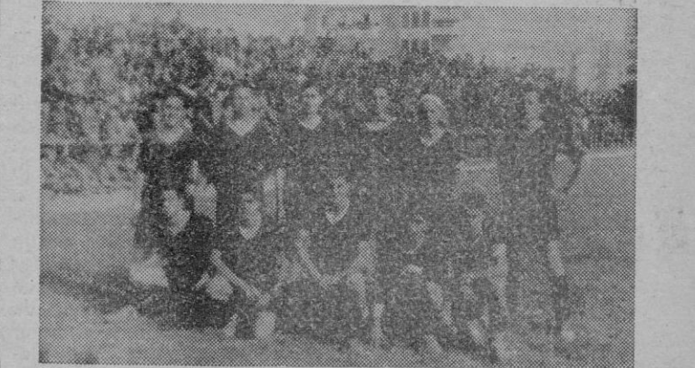
Equipo del Frente de Juventudes de Menorca, que resultó batido en la final, por los campeones de Mallorca.

listas llevan cuadros hasta en la camiseta.