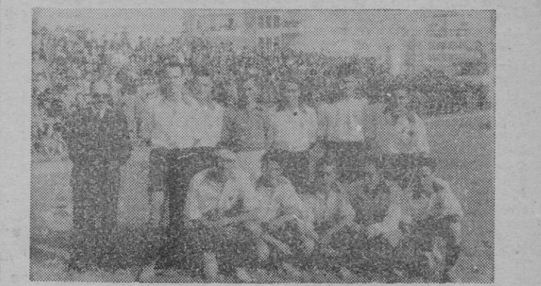
Equipo del Liceo Español que tras vencer magníficamente en la jornada final disputada en el campo de Buenos Aires a los representantes de Menorca, se clasifica Campeón de Baleares.

Se adjudica el Trofeo del diario "BALEARES"