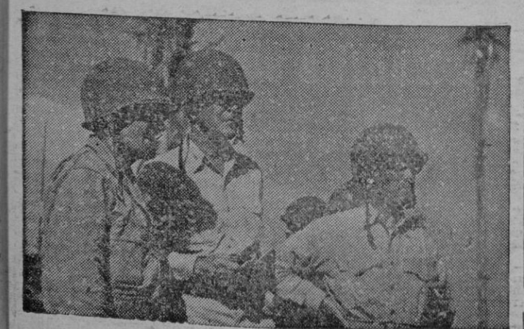
Aquí vemos al general Watson, al contraalmirante Hill y al coronel Ayers, Jefes de las fuerzas combinadas norteamericanas que desembarcaron en el Archipiélago Marshall.