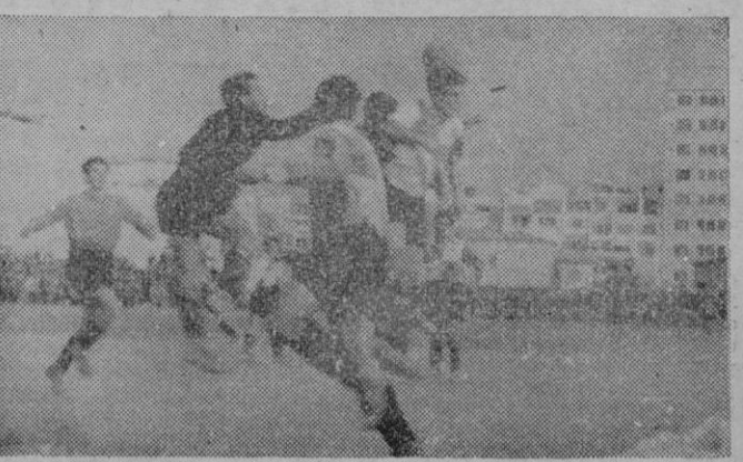
Y aquí otra de las múltiples intervenciones de Pujol protegido por defensas y medios, en evitación del remate de la delantera mallorquina.