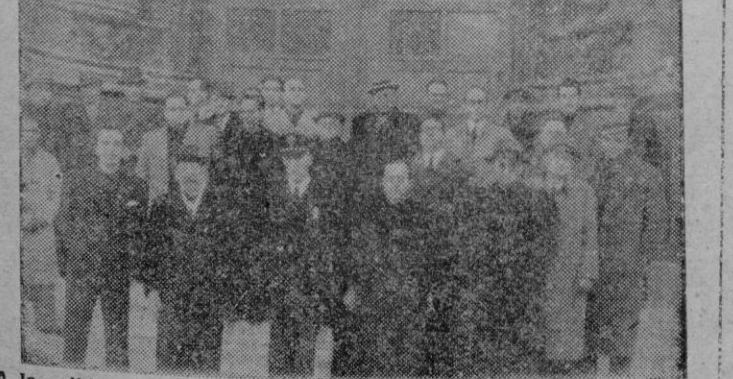
A la salida de San Francisco, fué obtenido este grupo de jerarquías, autoridades y periodistas que concurren a la misa solemne celebrada con motivo de la festividad de su Patrón, S. Francisco de Sales (Información en página 2.ª)