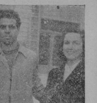
Torres y señora

Ya no preguntamos a nadie más. Nosotros dejaremos hoy