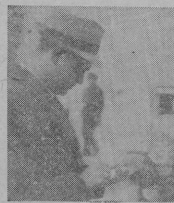
Un guardia civil.

El trayecto comprendido entre el Café Alhambra y la Plaza de Cort ha sido pródigo en los encuentros de personajes más o menos relacionados con el deporte.