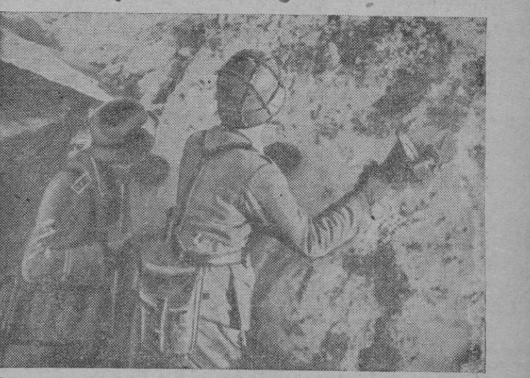
Estos granaderos tanquistas alemanes esperan el momento en que los tanques rusos estén cerca para proceder a su destrucción.