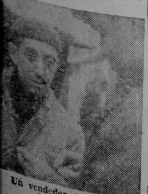
Un vendedor de revistas

sorprendido un tanto por lo inesperada. Con su niño en brazos responde a ella diciéndonos: Ganará el Mallorca por 2-1. Esta es mi quinta y me parece no muy disparatada. En la peluquería de Manue? continúa, y un «artilleteo» consistente de cuestiones futbolísticas, localizamos al «gran adho andaluz» de pura cepa que ha jugado más apuros en esta temporada que los que produce normalmente «cualquier secreto de la «Habana». Su porcentaje ha sido apostarlo con un porcentaje suficiente de torzamiento que le permita ganar. El «andaluz» se ha mostrado menos expresivo que otras veces a lo largo de la temporada por ello hemos acudido a él para que nos diera su opinión.