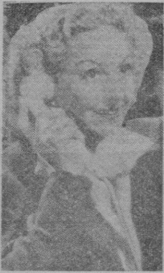
La inteligente y guapa estrella de nuestro cine María Santaolalla en una de sus recientes producciones.

Jerónimo Mihura empezará muy pronto, en los Estudios Ballesteros, el rodaje de su tercera película. —¿Título?— le preguntamos. —Provisionalmente se llama “El camino de Babel”. Pero quizá se cambie por otro si lo encontramos más expresivo. —¿Intérpretes?— Ninguno conocido. Esta va a ser una cinta de caras nuevas. Es muy difícil elegirlos con seguridades de éxito, pero creo que resultará muy bien.