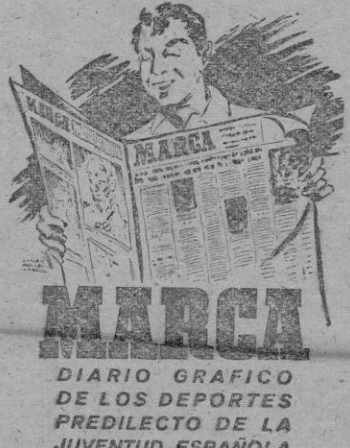
DIARIO GRAFICO DE LOS DEPORTES PREDILECTO DE LA JUVENTUD ESPAÑOLA