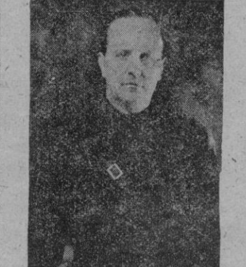
El camarada Raimundo Fernández Cuesta, nombrado Presidente de la Comisión de Tratados. (Foto Archivo).