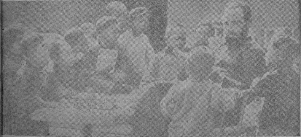
Catequesis en una escuela de la Santa Infancia a orillas del Hoang-Ho (Río Amarillo).