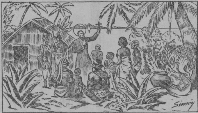
San Francisco Javier, en la India.

Amazonas hay también misioneros españoles soportando temperaturas atroces y una atmósfera saturada de humedad, donde todas las cosas se derriten si les es posible, víctimas de las fiebres,