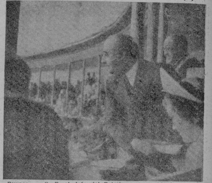
Burgos.—S. E. el Jefe del Estado, que preside la corrida celebrada con motivo del Milenario, lanza el regalo a uno de los matadores que le brindó la muerte de uno de sus toros.