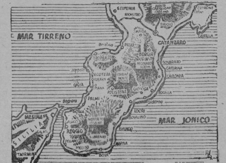
Aquí vemos representada en el croquis toda la península extrema calabresa, donde todavía se combate, y podemos precisar el nuevo desembarco de Montgomery realizado en el golfo de Santa Eufemia, que en el gráfico aparece en el extremo superior.