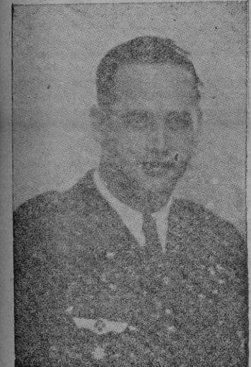
Los nuevos oficiales de Aviación tendrán en García Morato un maestro y un ejemplo.

Y los individuos civiles pueden aspirar al ingreso desde los 17 años hasta los 21, si prueban bue-