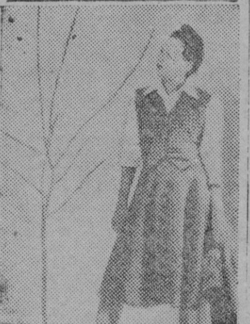
Lindo conjunto para campo. Lleva una chaqueta del mismo tejido que la falda para las horas frías del anochecer.

Por eso el noviazgo debe constituir un medio de comprobar la verdad del cariño, una oportunidad de realizar un estudio profundo de los respectivos caracteres para decidir al fin libremente si se quieren de verdad y congenian en todo.