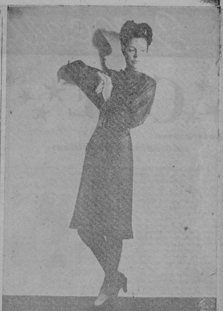
Vestido de lamé azul plateado con mangas japonesas.

Se toma la carne blanca de dos pechugas de pollo cocidas; se machacan en un mortero de piedra; se mezclan con medio cuartillo de salsa suprema clara, un tercio de azúcar y doce yemas, pasando todo esto por un pedazo de estameña muy limpio; luego se cuece en un molde untado con manteca al baño maría y se saca en la sopera con media libra de guisantes y treinta albondiguillas o pelotitas muy chiquitas de carne de