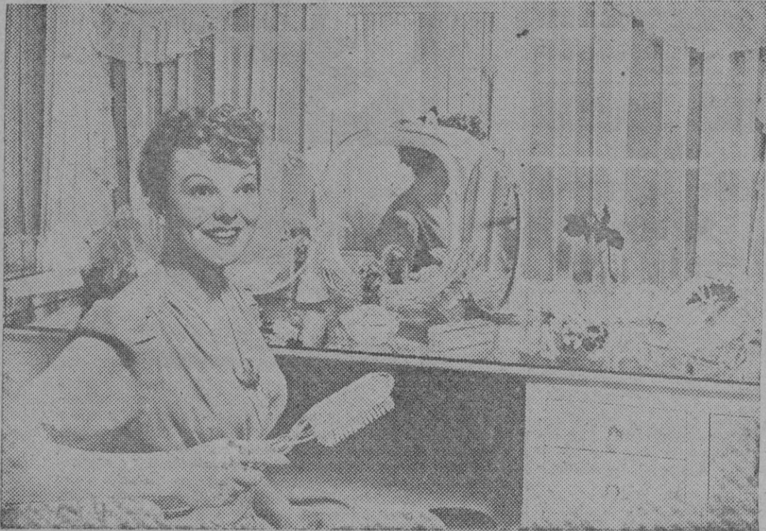
La encantadora actriz inglesa Anna Lee, posee una sedosa cabellera rubia, por lo que ha decorado su (boudoir) en blanco, para que entone con su belleza rubia. Este bello rincón que muestra la foto, se halla realizado por suntuosos cortinajes de seda blanca. Los objetos del tocador son de cristal plástico, como lo es también la complicada base que sostiene el espejo de tres lunas; la del centro orlada por un tubo a través del cual pasa la luz. La mesa está cubierta por un cojete, y el efecto es ultramoderno.

La moda y el decorado en el cuarto de las artistas de cine