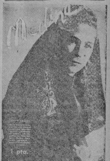
El presente número de «Medir» contiene el siguiente sumario:

Tuéstese ligeramente, póngase en el agua en una vasija cubierta y hiérvese lentamente hasta que, al tomar una poca en una cuchara, dejándola enfriar, se convierta en gelatina; luego cuélese y en fríese; añádase azúcar y zumo de limón, o ráspese un poco de corteza de limón cuando se vaya a usar.