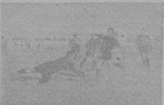
Una estirada del meta mallorquinista

El primer tiempo finalizó con el resultado de 2-1 favorables al Mallorca, marcados los dos pri-