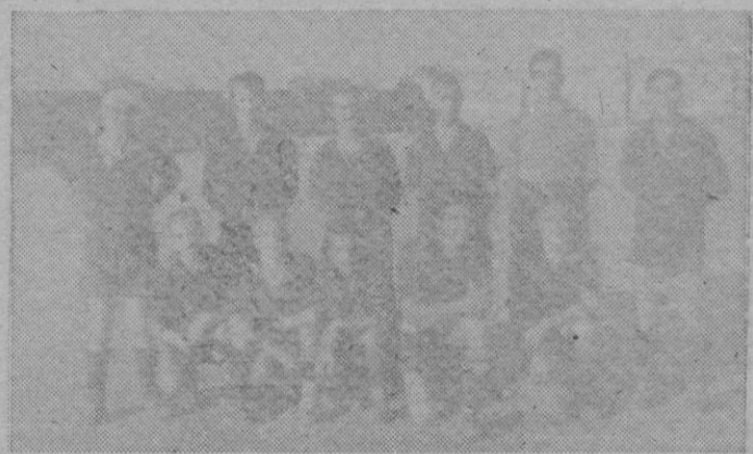
El equipo del Manacor

Fallando esta línea, no es posible hablar de «milagros» en la