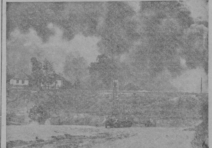
Al fondo de la foto se ven las humaredas de las explosiones en las líneas soviéticas al ser bombardeadas por los «Stukas» alemanes