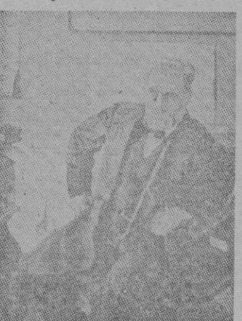
El eminente químico sueco fundador del Premio Nobel

Nobel, con la fabricación de la dinamita y otros explosivos, unida a la explotación de los yacimientos petrolíferos de Bakú en la cual le ayudaron sus hermanos Roberto y Luis reunió una inmensa fortuna, fortuna que dedicó íntegra a pre-