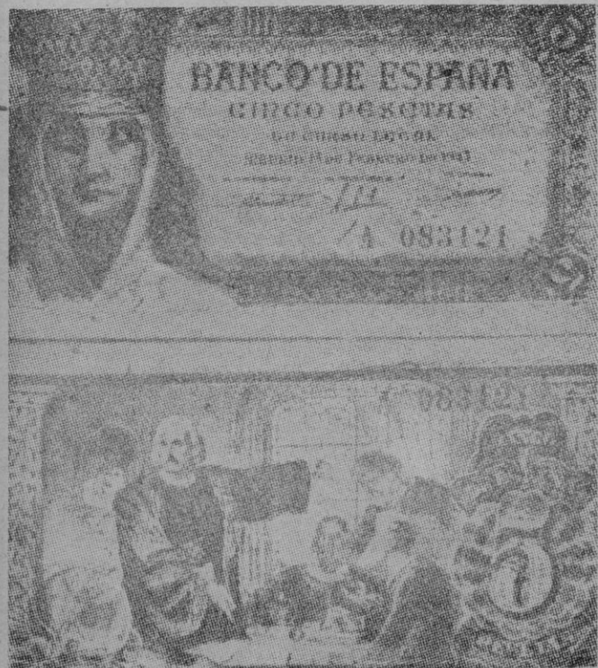
Anverso y reverso de los nuevos billetes de cinco pesetas que el Banco de España acaba de poner en circulación.