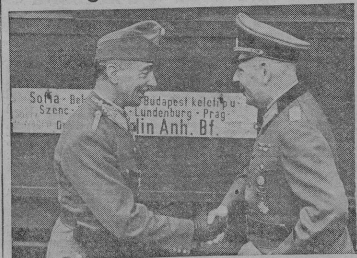
El general Csataj, Ministro de la Guerra de Hungría, se encuentra en Alemania para conferenciar con altas personalidades militares del Reich. Aquí le vemos a su llegada a Berlín siendo saludado por un representante del Alto Estado Mayor alemán