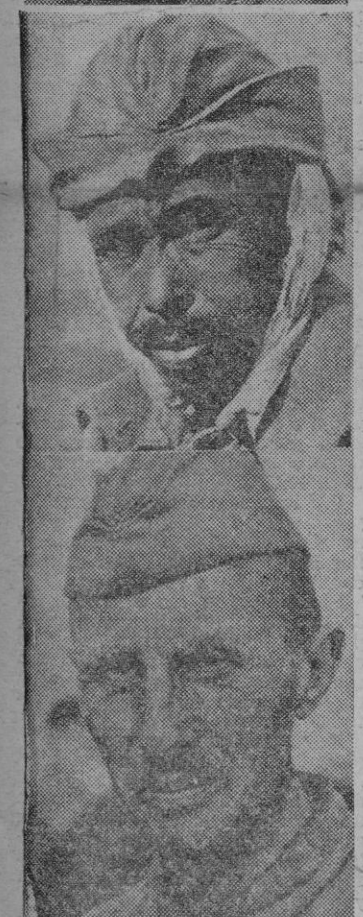
Representantes de cuatro razas asiáticas. Rostros que denuncian orígenes y procedencias más dispares. Rostros que se han deshumanizado al hablar de la crueldad de los Comisarios