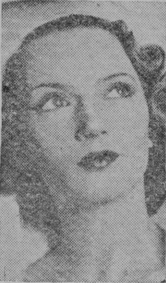
La belleza de la «estrella» máxima del cine francés, Annabella, fué realizada muchas veces por los vestidos del maestro

ton merecía la calificación de genio, pues era un creador. Innovador audaz, imperaba desde su «maison» de la calle Saint Flo-