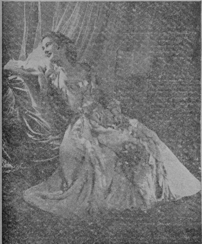
Mujeres del Mundo entero, artistas, millonarias, acudían a Patou cada temporada...

cañones. Sin embargo soportó con entereza las jornadas de fango y sangre, y en ocasiones, se batió con tanta valentía, que su nombre figuró en la mención de honor.