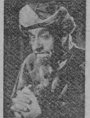
El caricato Miguel Liger que tantos éxitos ha obtenido en la producción nacional interpretando graciosos papeles y dando vida a toda clase de tipos.