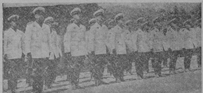
Se ha clausurado en El Escorial el Campamento de la Escuela Nacional de Mandos José Antonio, donde se han preparado los futuros instructores del Frente de Juventudes, a los que la «foto» nos muestra en una formación