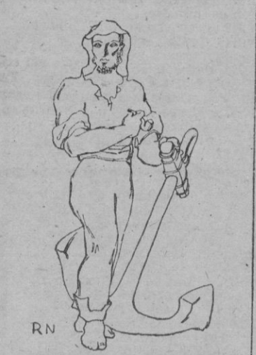
que al fin de cuentas es también un peligro en las rutas marinas, sin el auxilio de la Virgen, que acuna y vela siempre a toda nave. Los caballeros marinos nacen así a su devoción, y su amparo y ella les salvará, como la mejor ánclora, en las rutas de sus ilusiones y de sus sueños.

La inauguración de la Escuela Naval de Marín ha coincidido — sin duda a propio intento — con la festividad de la Virgen marinera. La Virgen de Agosto que, en procesión fervorosa, desembarca en las playas de pescadores, morena de brisas y con collar de sales y orla de espuma, recien puesta, en su canto azul recamado de aljofar y chapinetas. Ningún día más bello, pues, que este de la Virgen del mar para inaugurar una Escuela que ha de dar a España, como propugna la Falange, la «potencia marítima para el peligro y el comercio».