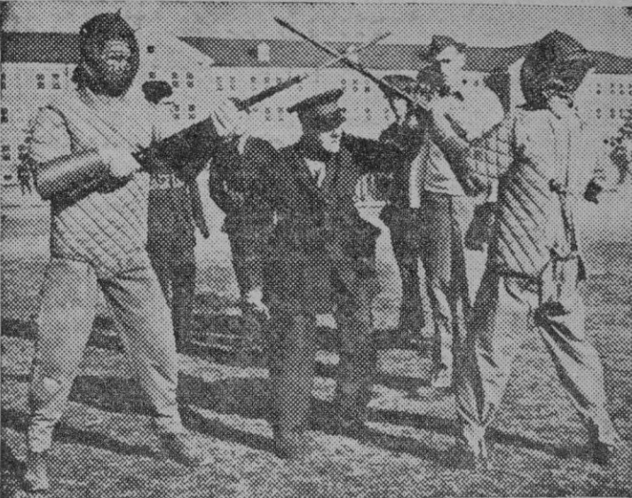
El Coronel Bidale enseñando a los reclutas yanquis el empleo de la bayoneta