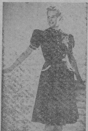
Nada más juvenil que este traje de tajarón negro adornado con trencilla blanca.