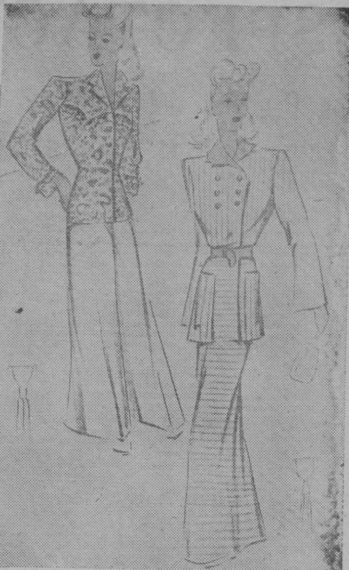
Presentamos hoy dos bellos conjuntos caseros, muy adecuados para estos tiempos calurosos.

Es muy importante elegir con esmero estos indumentos hogareños que permiten a un tiempo gran libertad de movimiento para ocuparse de las tareas domésticas y que no son obstáculo para recibir a las amistades de mucha confianza.