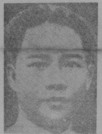
Wang-Ching-Wei, que estos días ha llegado a Shanghai

Alemán Gran Cuartel General del Fuhrer. — El Alto Mando de las fuerzas armadas alemanas, comunica: «En el Mius el enemigo ha renovado sus tentativas de asalto para reconquistar el terreno que había perdido en los días precedentes.