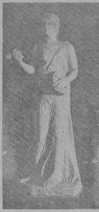
Cloris, mujer de Céforo.

que en él se advierte. No sabemos con qué fundamento han asegurado algunos que esta estatua es de Adonis o de Meleagro.