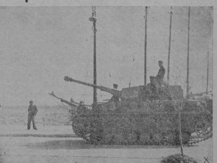
Llega al puerto un nuevo modelo de tanque.