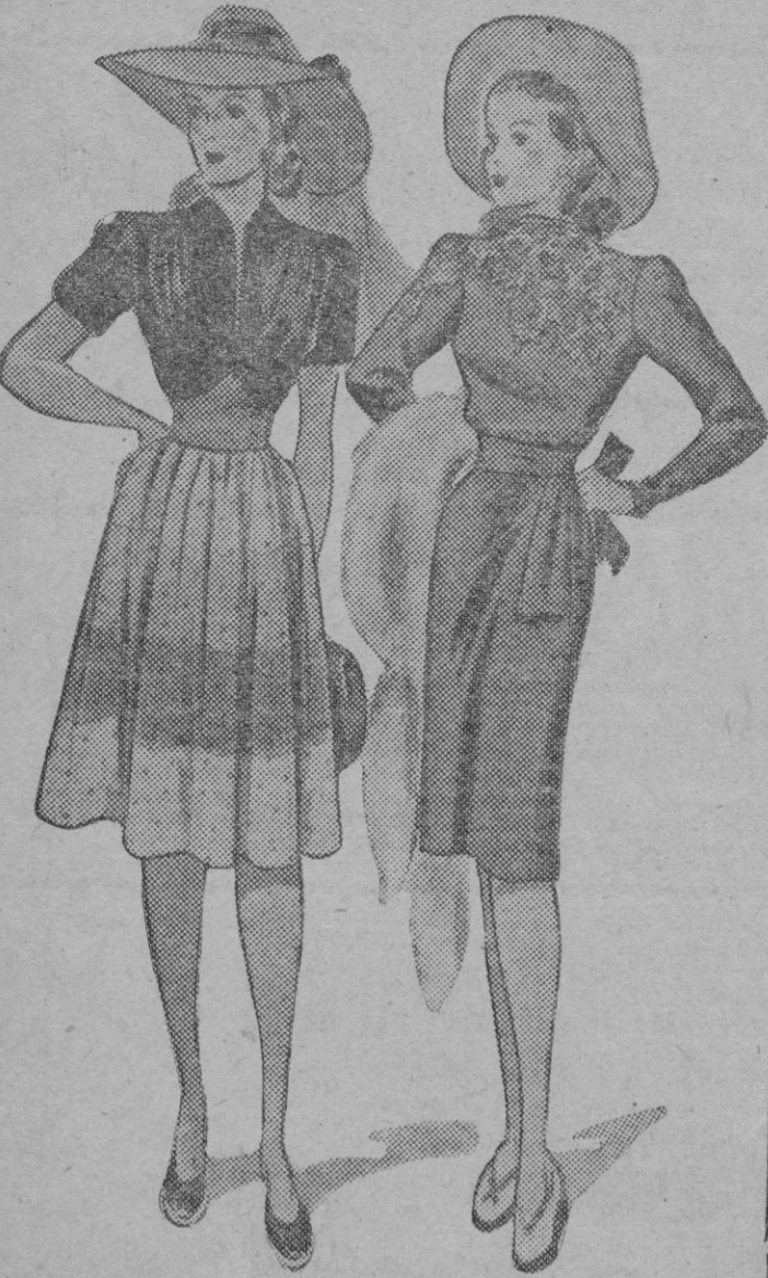
Bello conjunto en seda. La falda está hecha a franjas de tres tonos. La cinturilla es de color vivo y el delantero fruncido. El segundo modelo está realizado en crepón de China. El adorno que desciende por una manga es una iherustación.

8. Si teméis que el sol os arrugue el cutis en las inmediaciones de los ojos, protegédolo con una crema de tocador, distinta a la oleosa que empleáis para tostaros, superponiéndola a la primera. Esta doble capa permite el dorado uniforme sin esclerosar esa frágil porción de vuestro rostro.