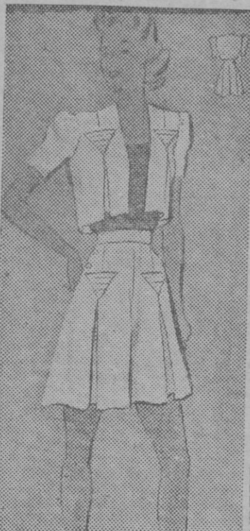
Falda y bolero constituyen en este modelo un bello conjunto para playa.

La mujer de nuestros tiempos se debe a su propia vida, y esta es activa, cálida, dinámica. Su pensamiento y su acción se hallan embargados por preocupaciones más serias y tiene plena conciencia de su misión y de su responsabilidad. ¿No resulta, pues, pueril, asimilar a la mujer contemporánea a la del medioevo, o, mejor dicho, al retrato — más o menos fidedigno — que de la mujer nos han dejado los sabios y poetas del pretérito?