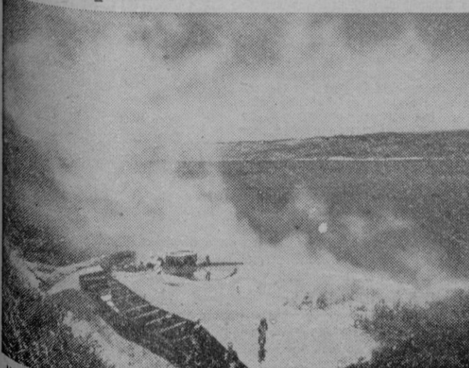
He aquí una batería costera de la isla Pantelaria después de un intenso fuego para repeler un ataque naval enemigo.