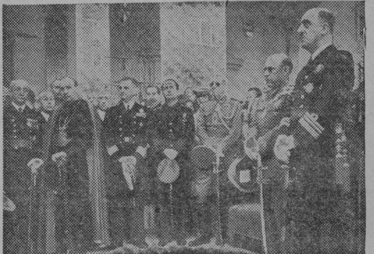
Un momento del solemne acto inaugural