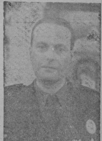
EL MINISTRO DE LA GOBERNACION

El grupo consta de 72 viviendas que se levantan en tres pisos de forma rectangular, alrededor de un patio central. El coste de las obras se eleva a dos millones y medio. Las viviendas son de tres tipos de precios de alquiler, de 70 90 y 125 pesetas, respectivamente. El tipo intermedio tiene tres habitaciones, cocina, comedor y cuarto de aseo y el tipo superior tiene terraza, mejor orientación, despensa, cocina económica con termo-sifón y cuarto de baño. Estas últimas viviendas están situadas frente al mar. Hay un jardín con una pequeña piscina.