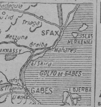
Map showing the Mediterranean region, highlighting the Gulf of Gabes and the area around Sfax and Maharés.

El ataque británico a lo largo del Golfo de Bengala para apoderarse de la península del Río Mayu con Akyab, su capital ha fracasado totalmente con el aniquilamiento de la 6ª Brigada angloindia que Wellbtonzó a la ofensiva, desvaneciéndose así los japoneses toda amenaza. El fracaso de esta ofensiva británica hace temer de nuevo a los ingleses por la suerte de Bengala primera gran provincia de la India.